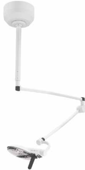
Montado en techo