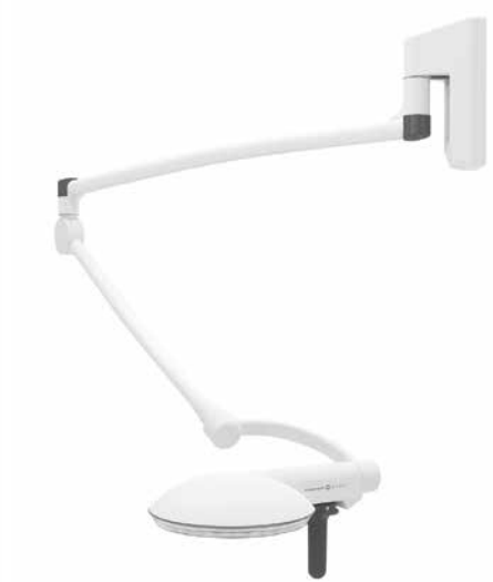
Montado en pared