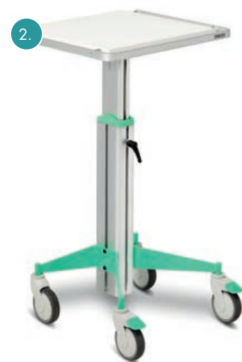
Stora länkhjul av hög kvalitet gör vagnarna enkla att flytta.