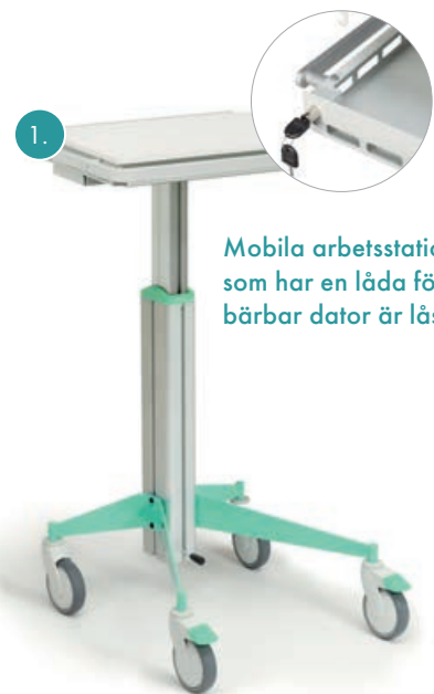
Mobila arbetsstationer som har en låda för bärbar dator är låsbara.