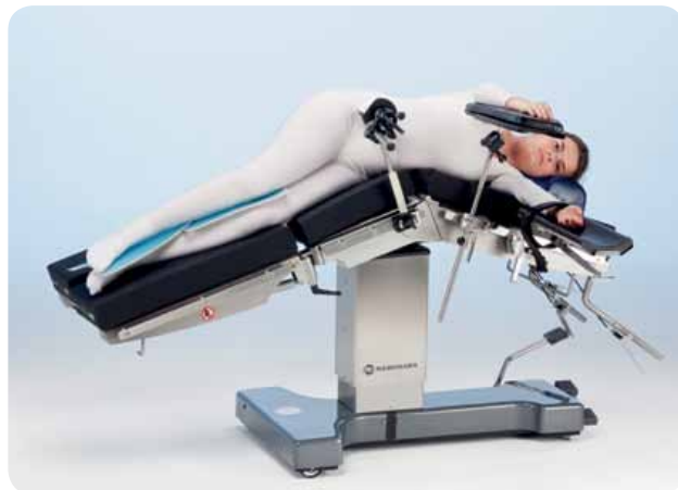
Латеральное положение для общей хирургии без опоры для операции на почках.