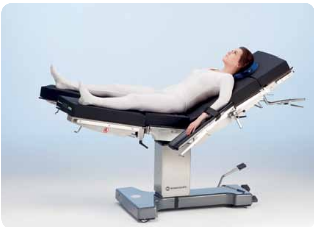
Позиция литотомии с разделенной ножной секцией, например, для лапароскопии и бариатрической хирургии