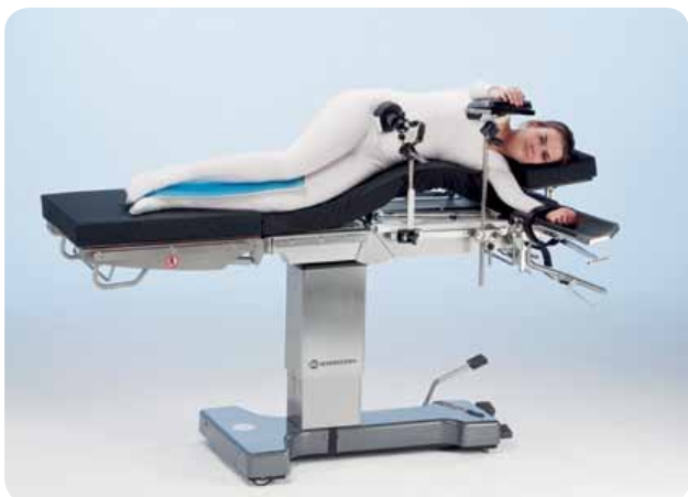
Латеральное положение с flex или с опорой для операции на почках для операции на почках/ торакальной хирургии.