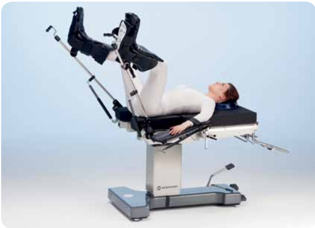
Позиция литотомии с опорами для ног, например, для гинекологии/урологии