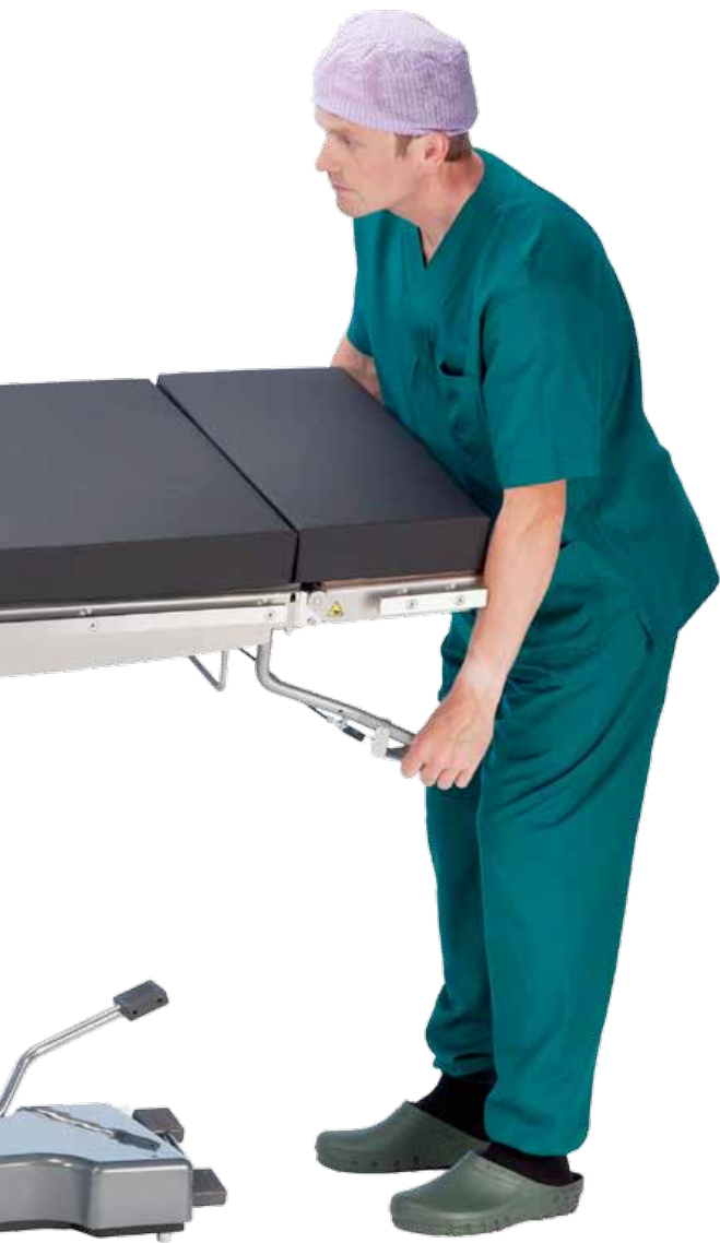
Боковой наклон с помощью газовой пружины