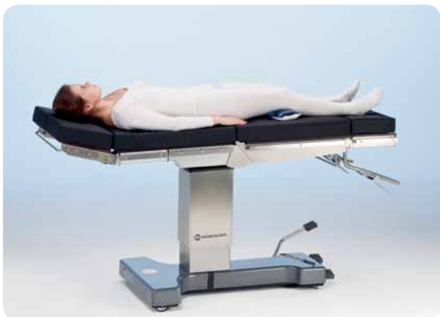
Обратное положение для общей или ЛОР-хирургии.