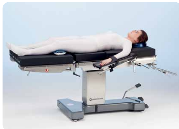
Положение «лежа на спине» для общей хирургии.