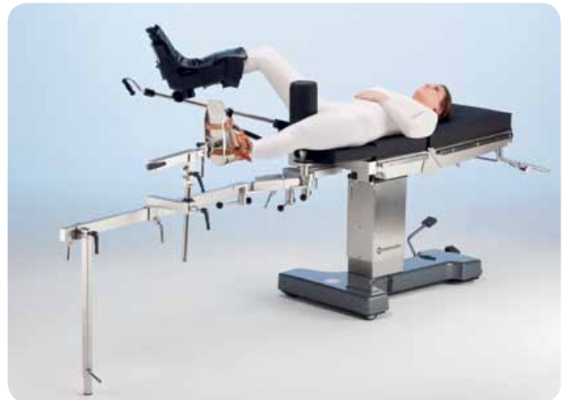
Ортопедическое приспособление 19300 для травматологии

За дополнительной информацией обращайтесь, пожалуйста, к нашему каталогу или сайту: www.merivaara.ru .