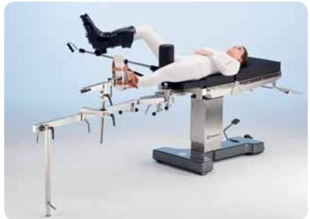
Ortopedisk förlängningsenhet 19300 för traumakirurgi

Mer information om konfigurationer och tillbehör finns på www.merivaara.com . Du kan även kontakta din närmaste Merivaara-representant, kontaktinformation finns på webbplatsen.