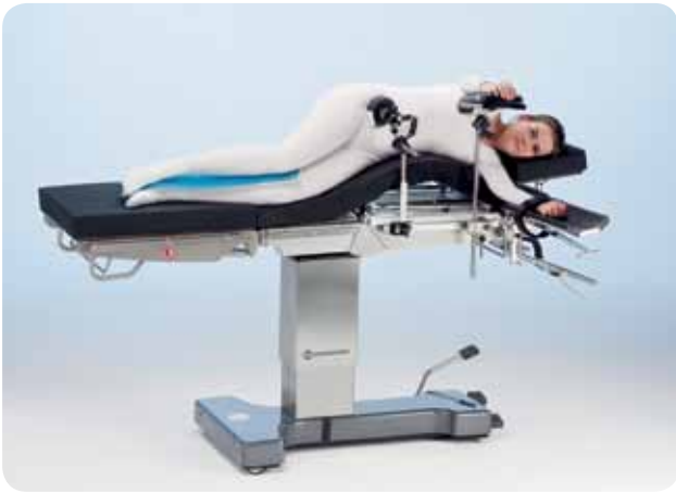
Sidoläge med flex eller njurbrygga för njur-/bröstkorgskirurgi.