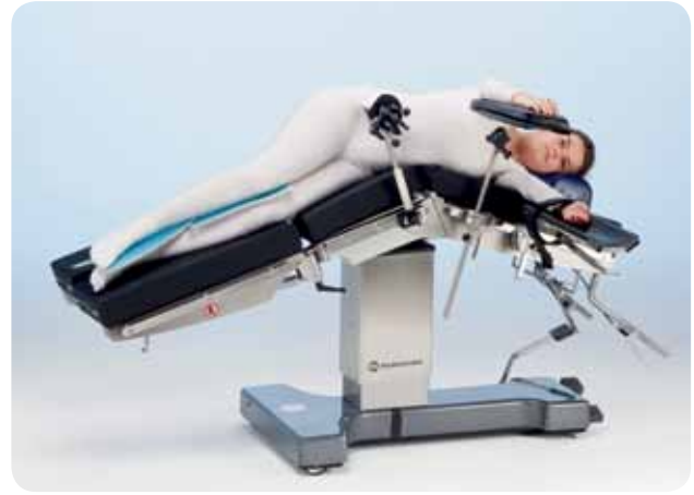
Sidoläge för allmän kirurgi utan njurbrygga.