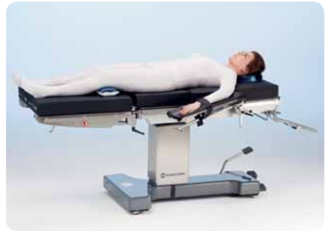
Liggande läge för allmän kirurgi