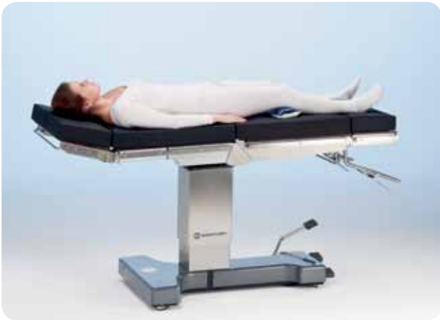
Omvänt läge för allmän eller ÖNH-kirurgi