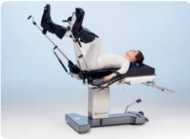
Litotomiposition med byglar och benstöd för exempelvis gynekologisk och urologisk kirurgi